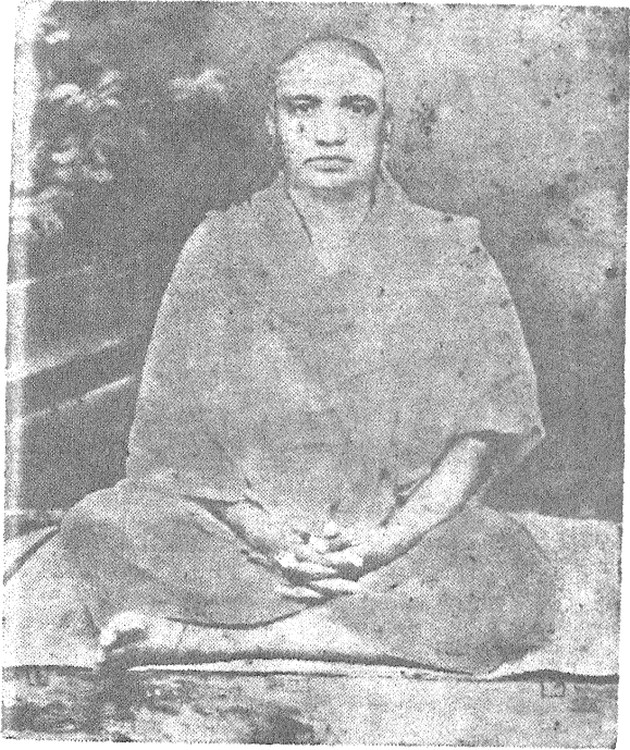
ಶ್ರೀ ಶ್ರೀ ಶ್ರೀ ರಾಮಕೃಷ್ಣಾನಂದಜಿ